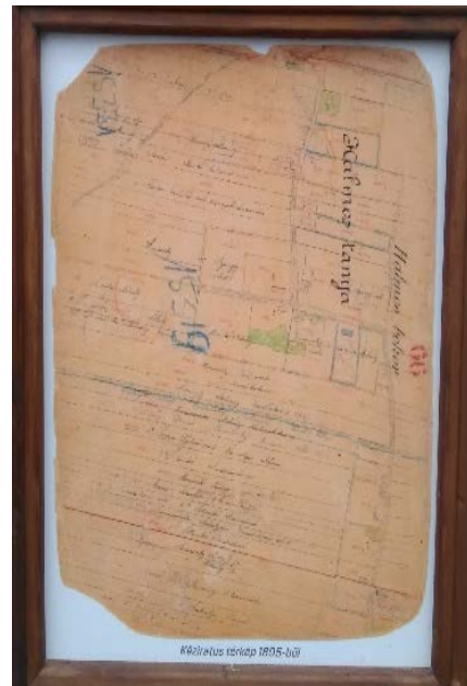
Tírják emlékhely – Halmosbokor

A fotókon a Halmosbokorban nemrég kialakított Tírják emlékhelyet láthatják, mely létrejöttéhez jelentős mértékben hozzájárult Ágota. Ezáltal példát mutatva arra is, hogy kutatásainak sokrétű hozadéka a településfejlesztéshez is hozzájárul.